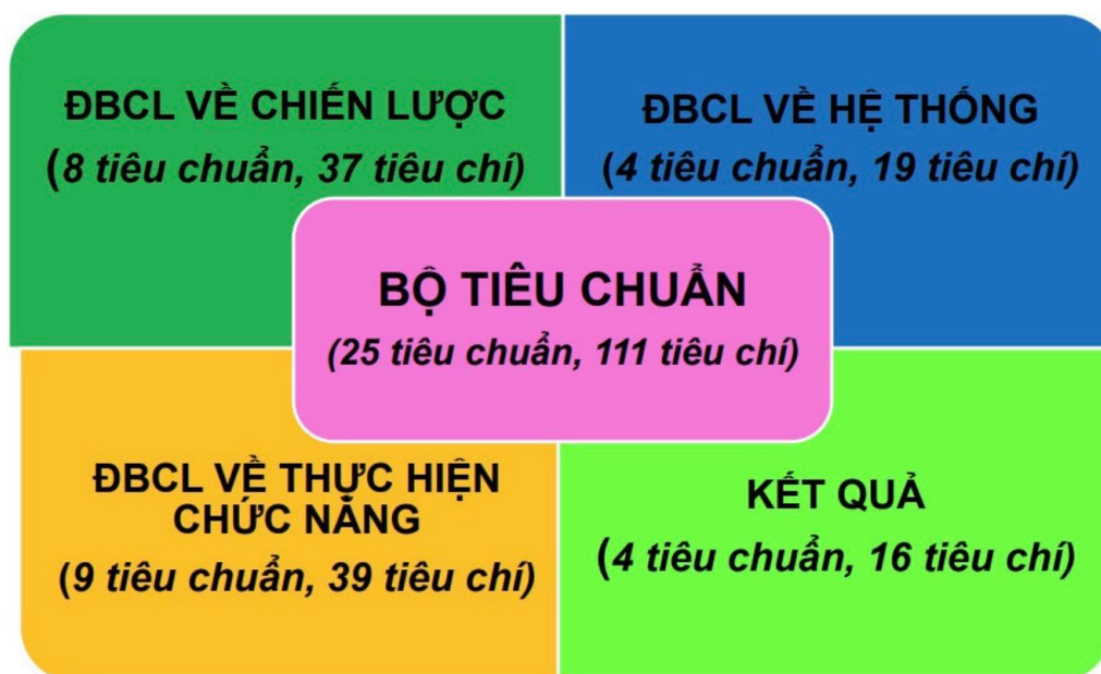
Hình 02: Bộ tiêu chuẩn đánh giá chất lượng cơ sở giáo dục đại học tại Thông tư số 12/2017/TT-BGDĐT ngày 19 tháng 5 năm 2017.

xây dựng; Lâm sinh đã được đánh giá ngoài và nhận giấy chứng nhận đạt kiểm định chất lượng chương trình đại học năm 2020 và 2021. Năm 2021, Nhà trường tiếp tục triển khai tự đánh giá 04 chương trình đào tạo trong đó có 02 chương trình đào tạo trình độ thạc sĩ ngành: Quản lý kinh tế; Quản lý tài nguyên rừng và 02 chương trình đào tạo trình độ đại học ngành: Kế toán; Thiết kế nội thất. Hiện tại 04 ngành này đã hoàn thành báo cáo tự đánh giá và đang triển khai thủ tục để thực hiện đánh giá ngoài. Trong số 13 chương trình đào tạo thực hiện trên có 12 chương trình đào tạo theo tiêu chuẩn của Bộ Giáo dục và Đào tạo (theo chuẩn Việt Nam), còn 01 chương trình đào tạo trình độ đại học ngành Quản lý tài nguyên thiên nhiên (Tiếng Anh) thực hiện tự đánh giá theo chuẩn AUN-QA.